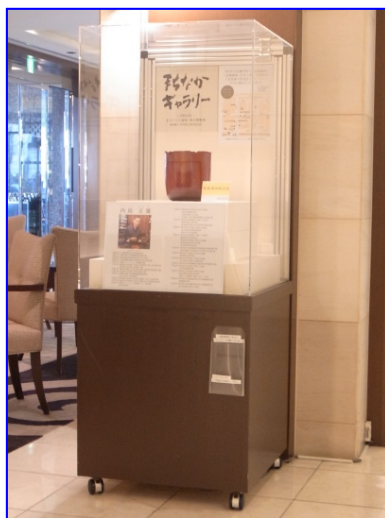
展示場所:ホテルニューオータニ高岡

まちなかギャラリーでは、高岡の 工芸作家の作品を中心商店街の ショーウィンドウに展示していま す。 高岡の歴史と伝統を受け継いだ 美術工芸作品の本物の美しさ、 素晴らしさを実際にご覧頂けます。 展示している工芸作家の作品のご 購入に関しては、ご相談ください。