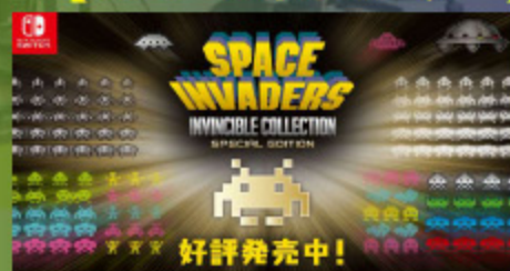
© TAITO CORPORATION 1978, 2020 ALL RIGHTS RESERVED.