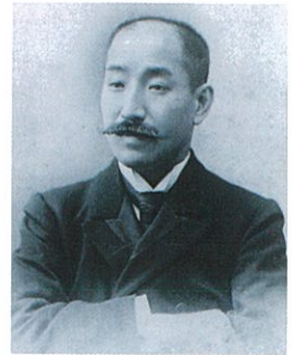
林忠正肖像(個人蔵)

現高岡市一番町出身の美術家・林忠正(1853～1906)は、長年パリで画商として活躍し、ヨーロッパに浮世絵などの日本美術を紹介するなど、東西美術交流に多大な貢献を果たした人物で、令和8年(2026)は林忠正の没後120年となる節目の年にあたります。本展では林忠正が残した書簡などを中心に展示・紹介します。