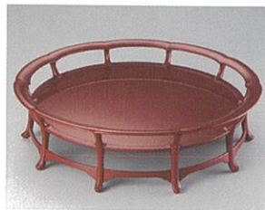
林 暁《朱塗御付盤》2022年

休館日／月曜 (祝・休日の場合は翌平日) 観覧料／一般800円(団体・シニア640円)、大学生500円(団体400円)、 高校生以下無料 ※林 暁 漆藝展は無料