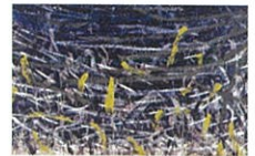
堀浩哉「ローマで鳥を見た14」1991年