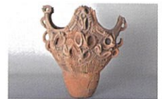
縄文土器 早月上野遺跡出土

休館日／月曜(祝・休日の場合は翌平日) 観覧料／一般800円(団体・シニア640円)、 高校・大学生500円(団体400円)、 中学生以下無料