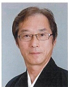
東海 煌山(とうかいこうざん) 都山流 尺八 竹琳軒大師範

日本講談協会元会長。女流講談師として各地で一人芝居をミックスした新感覚の公演を行うほか、古典の演目では、2008年から2009年にかけては日本講談協会会長を務めた。8月の怪談断、12月赤穂義士伝では、毎年演芸場でとりを務めている。また、時代の史実を次世代に残す語り部として活動する神田紫の話芸は、現在のSDGsにもつながる演目も多く、創作講談にも力を入れている。