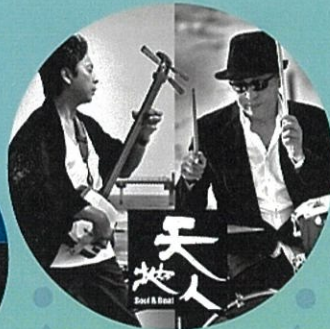
Soul & Beat TEN-CHI-JIN ソウルアンドビート テンチジン SAHMISEN / Percussion