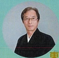
東海 煌山 尺八