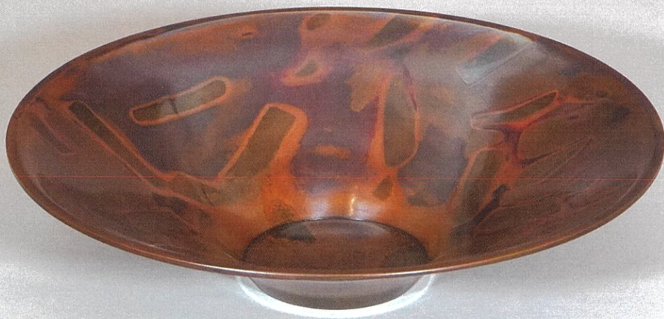
日本工芸会賞 銅鑄盤 般若 泰樹 作

午前9時30分~午後5時(入場は4時30分まで)5月24日(金)は午前10時30分から<月曜休館>