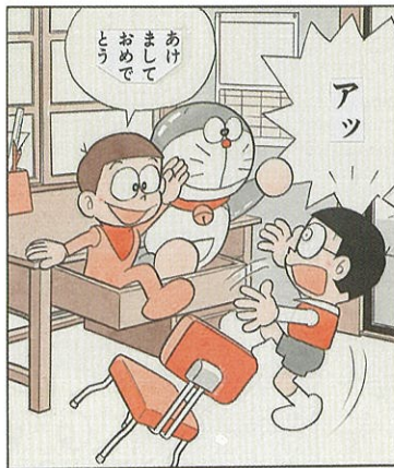
第1期 ドラえもん 「未来から来たドラえもん」

藤子・F・不二雄先生が描き続けた「児童まんが」。 時代を問わず子どもたちに親しまれ続ける作品の魅力は、 どこからくるのでしょうか？ 今回の展示では、特徴的ないくつかのモチーフ、テーマの中 から3つを選び、3期にわたってご紹介します。