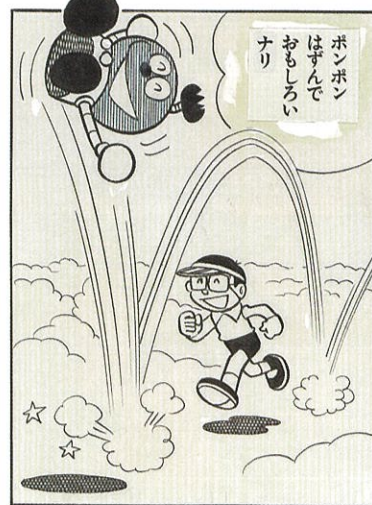
第3期 キテレツ大百科「仙鏡水」