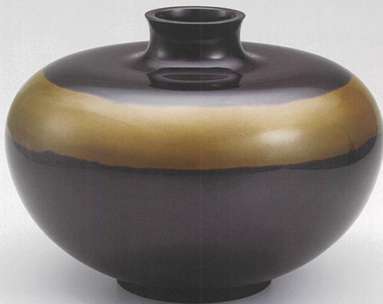
「吹分花器」 般若 保作

午前9時30分~午後5時(入場は4時30分まで)5月21日(金)は午前10時30分から(月曜休館)