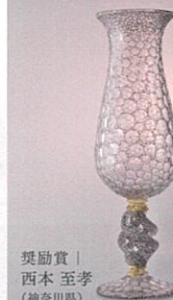
奨励賞 | 西本 至孝 (神奈川県)