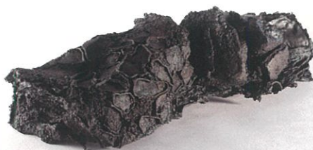
優秀賞 | 留守 玲 (神奈川県)