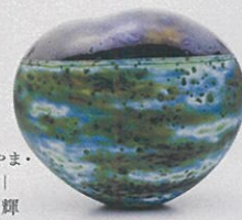
工芸とやま・ 特別賞 | 宮本 崇輝 (富山県)