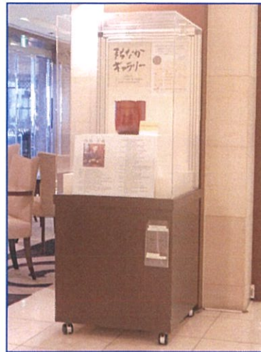
展示場所:ホテルニューオータニ高岡

高岡の歴史と伝統を受け継いだ 美術工芸作品の本物の美しさ、 素晴らしさを実際にご覧頂けます。 展示している工芸作家の作品のご 購入に関しては、ご相談ください。